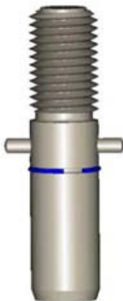
Axe avec circlip